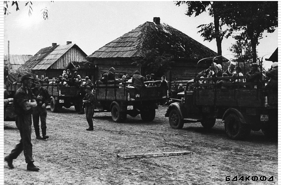
Солдаты войск СС сопровождают машины с жителями г. Могилева перед отправкой в Германию. 1943 г.