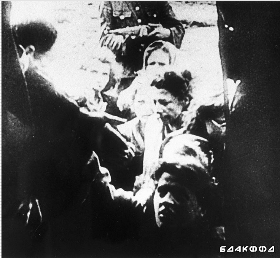
Жителей г. Минска грузят в железнодорожные вагоны для отправки на работу в Германию. 1941–1944 гг.

Во время войны общее число принудительных трудовых лагерей в Третьем рейхе составляло 20 000 .