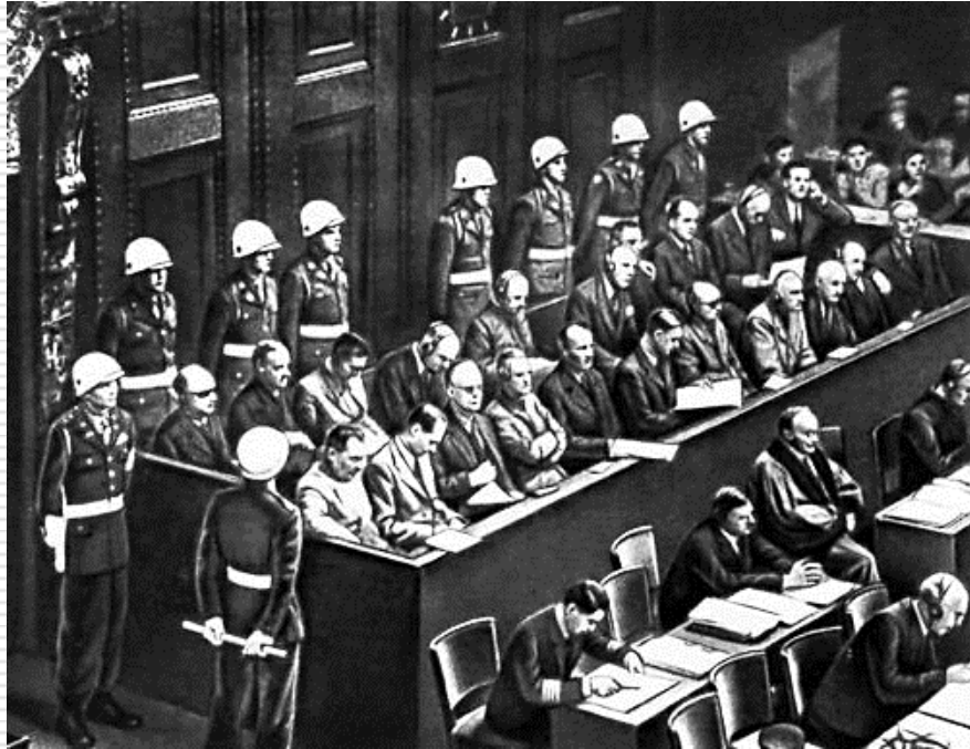
Нюрнбергский процесс над военными преступниками. 20 ноября 1945 г.

81 год назад нацистская Германия напала на Советский Союз. Беларусь первой приняла удар врага.