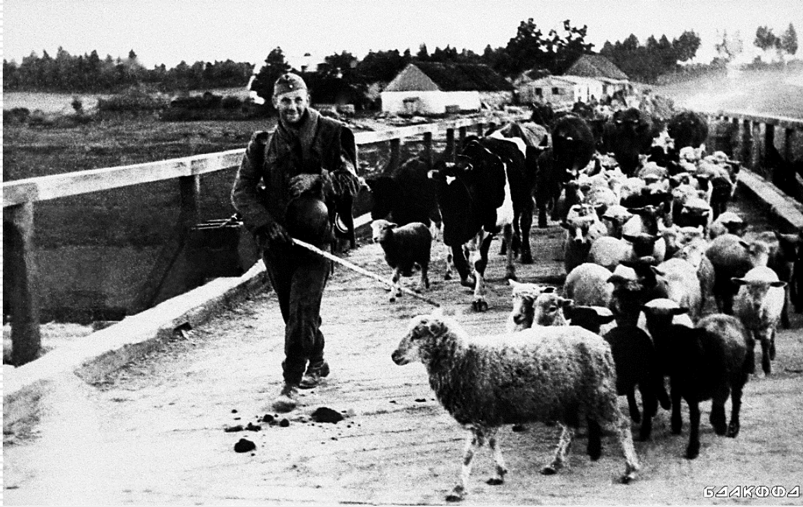
Немецкие оккупанты угоняют скот у сельчан. 1943 г.