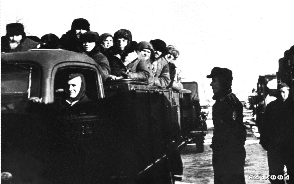
Оккупационные власти отправляют на работу в Германию гражданское население. 1943–1944 гг.