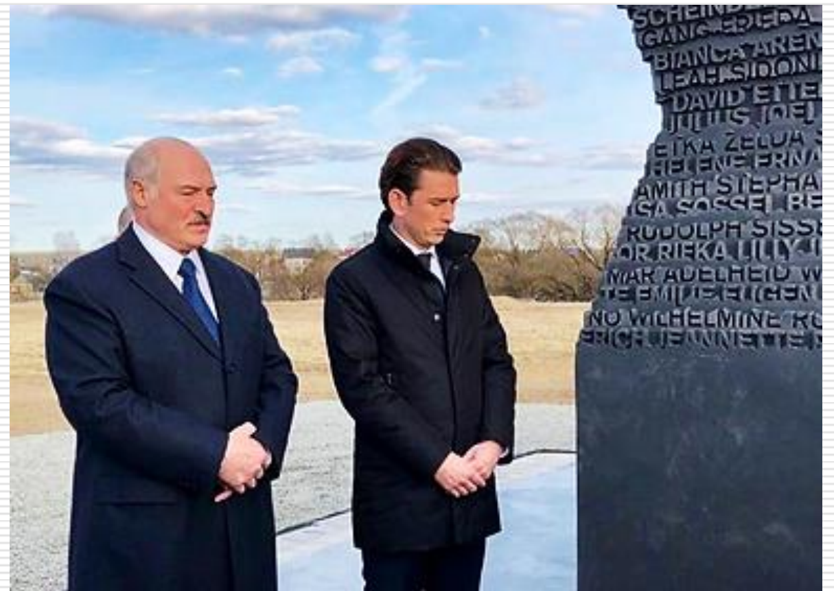
В церемонии открытия памятника «Массив имён», посвящённого австрийским гражданам, погибшим в Тростенце, приняли участие Президент Беларуси А.Г. Лукашенко и федеральный канцлер Австрии Себастьян Курц (28 марта 2019 г.)