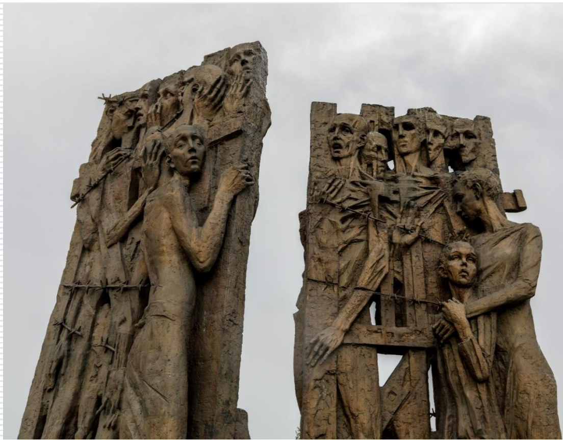
«Ворота памяти». Мемориальный комплекс «Тростенец»