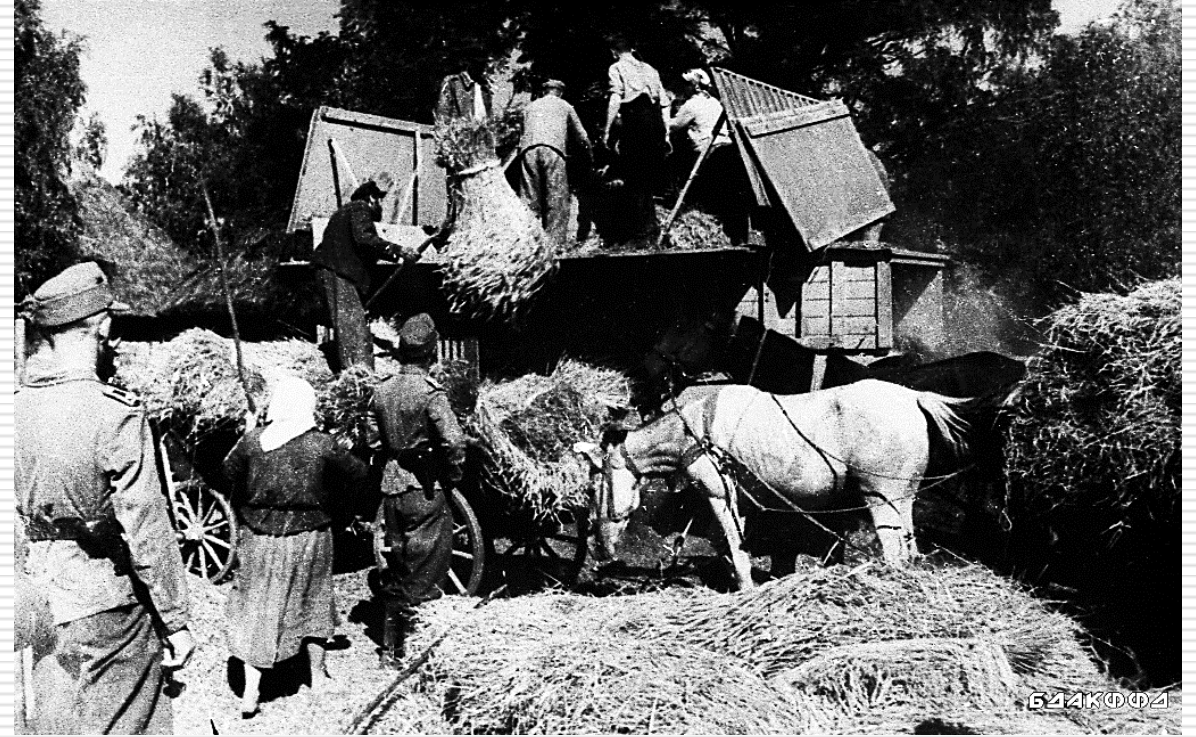
Крестьяне молотят зерно под контролем немецких солдат. 1943 г.